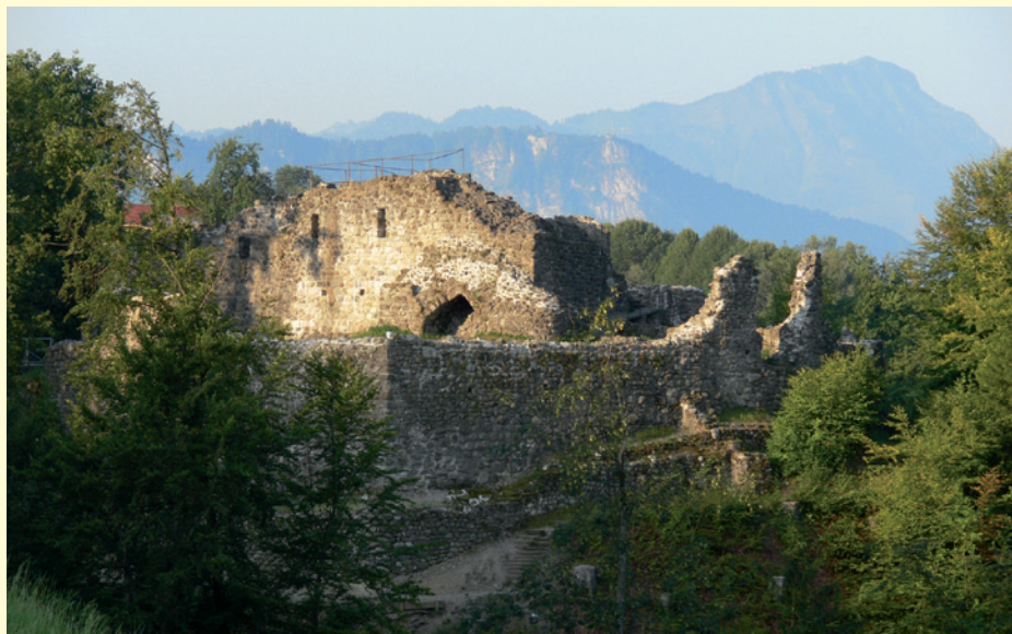
Ruine Gesslerburg in Küssnacht - Ruine einer einst imposanten Burganlage

Der einzigartige Wanderweg mit wunderschönem Panorama von Immensee nach Gersau