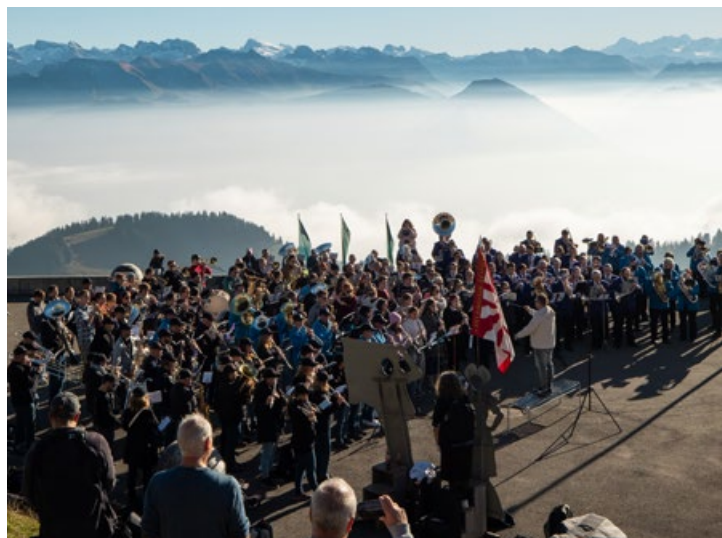
Auf das Blasmusikfestival im letzten Jahr folgen 2026 weitere Projekte am Musikberg Rigi.

Das WC Unterstetten befindet sich in einem baulich und qualitativ ungenügenden Zustand und entspricht den heutigen Anforderungen an Komfort und Infrastruktur nicht mehr. Eine Frequenzmessung der RIGI BAHNEN AG zeigt die hohe Nutzung des Panoramawegs zwischen Rigi First und Rigi Scheidegg: durchschnittlich rund 400 Personen pro Tag, an Spitzentagen über 2000 Gäste. Diese Zahlen unterstreichen die Bedeutung