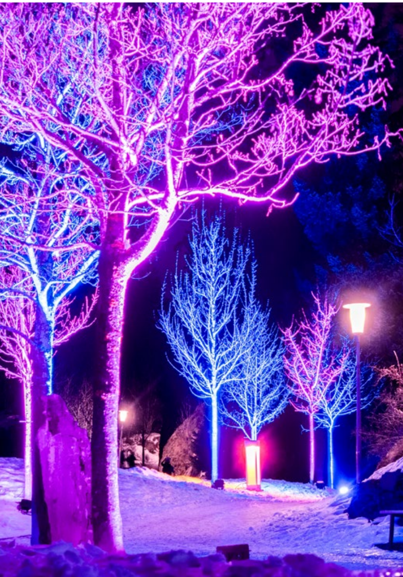
Für das erste Lichtfestival Rigi 2026 wurden 2025 die Grundlagen geschaffen.

durch effizienter ausgerichtet werden. Die RigiPlus AG investierte weiterhin in die Sicherstellung dieser Dienstleistungen und übernimmt unter anderem für den Verein Pferdestall die jährlichen Unterhaltskosten für Energie und Wasser.