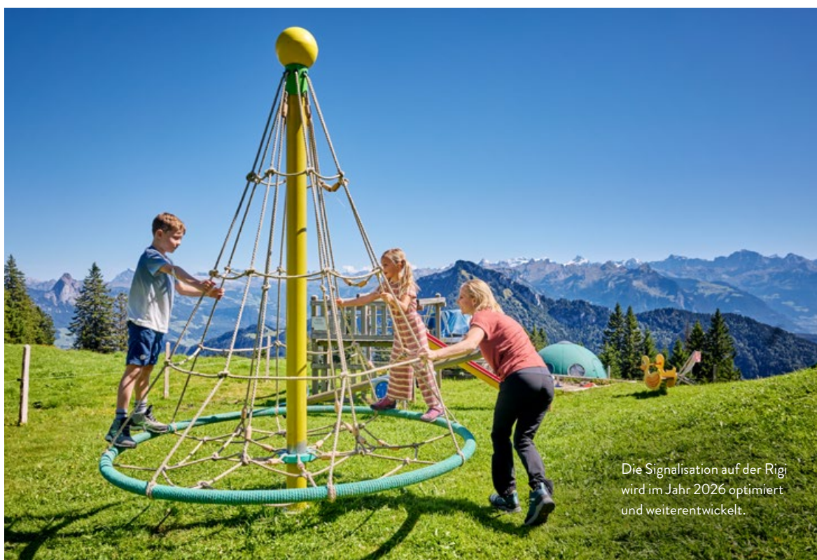
Die Signalisation auf der Rigi wird im Jahr 2026 optimiert und weiterentwickelt.

Im Rahmen des Mountainbike-Projekts soll bis Ende 2026 in einem der definierten Handlungsräume – Küssnacht–Arth beziehungsweise Lauerz–Gersau – eine Route ausgeschildert werden. Damit wird ein erster Schritt zur Besucherlenkung des Bike-Verkehrs auf und um die Rigi umgesetzt. 2026 werden dazu gemeinsam mit Bikegenoss Zentralschweiz Gespräche mit betroffenen Grundeigentümerinnen und Grundeigentümern geführt. Ziel ist eine klar geregelte und langfristig tragfähige Nutzung der Wegeinfrastruktur.